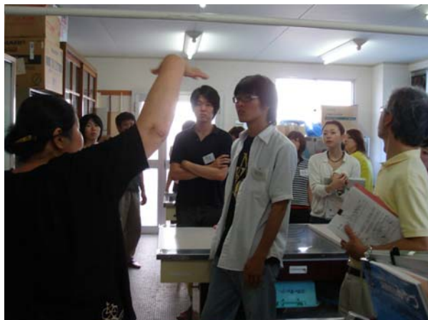
調理場の使い方指導