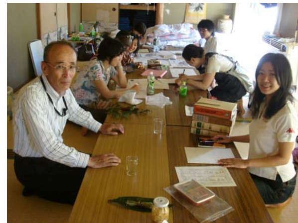
由良のお話を伺う