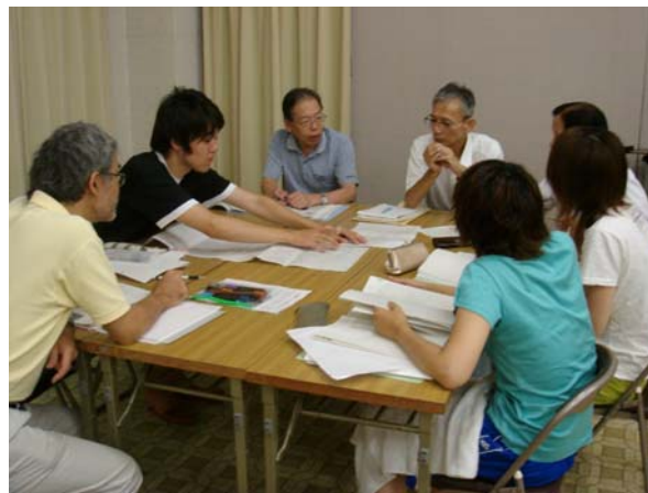
調査ミーティング