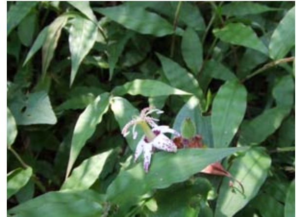
ヤマジノホトトギス